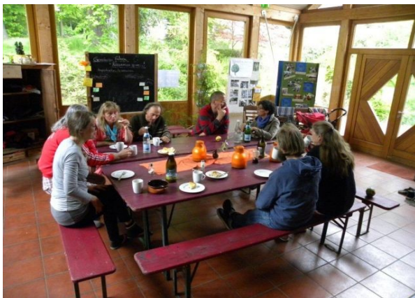
Seminarpause bei den GASTWERKEN