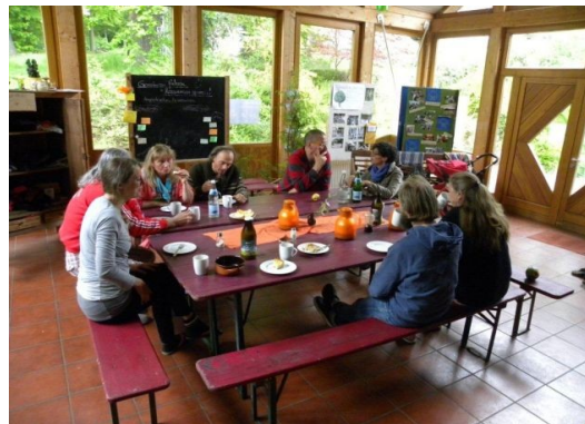
Seminarpause bei den gASTWERKEN

www.lossehof.de www.gastwerke.de www.villa-locomuna.de www.lebensbogen.org www.kommune-niederkaufungen.de www.mensch-meierei.org