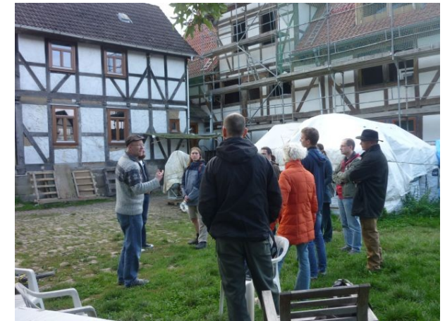
Seminargruppe auf dem Lossehof

Die sechs Kommunen sind Teil des Netzwerkes der politischen Kommunen „KommuJa“. Infos über das KommuJa-Netzwerk gibt es im Netz unter: www.kommuja.de