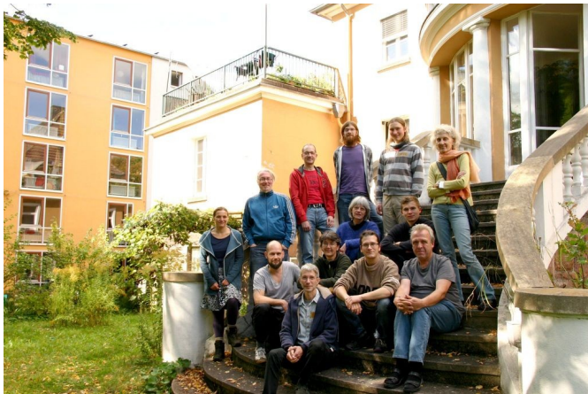
Seminargruppe in der Villa Locomuna

Alle Gruppen wirtschaften gemeinsam in eine Kasse und treffen ihre Entscheidungen im Konsens. Im Laufe der Jahre haben sich die sechs Kommunen in der Region Kassel immer mehr vernetzt und gemeinsame Projekte auf den Weg gebracht wie die „Solidarische Landwirtschaft“ (Solawi) und andere gruppenübergreifende Arbeitskollektive.