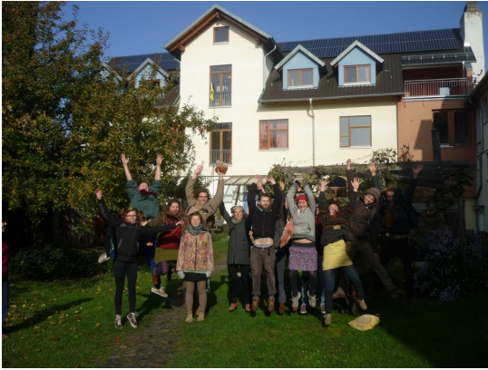
Seminargruppe in Niederkaufungen